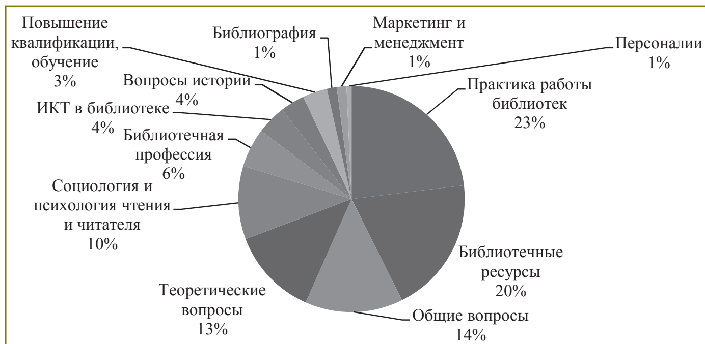
Рис. 1. Тематика статей в начальный период создания журнала (2003 г.)